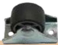
מק"ט - TD225