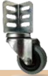
מק"ט - LU10