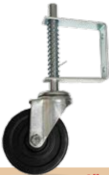
גלגל לשער עם קפיץ קוטר 4"