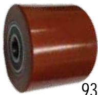
קושי: 93 Shore A