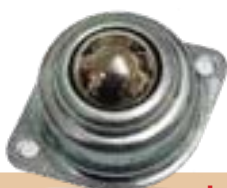
מק"ט - LA25