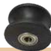
גליל מסילה חריץ U