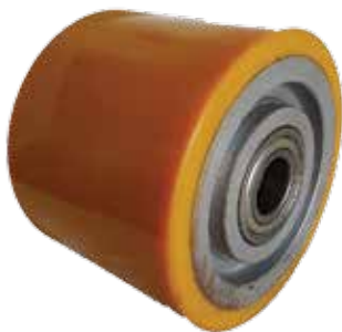
קושי: 98 Shore A