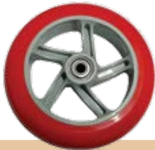
גלגלי קוטר 140 לקורקינט