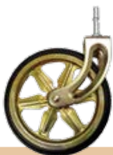
גלגל מעוצב לעגלות תה