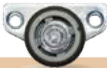
מק"ט - LU02