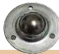
מק"ט - LA19