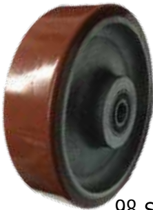
קושי: 98 Shore A