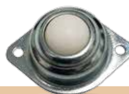
מק"ט - LR25