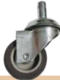
גלגלי פין 11