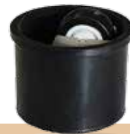
גלגלי ריהוט כוס